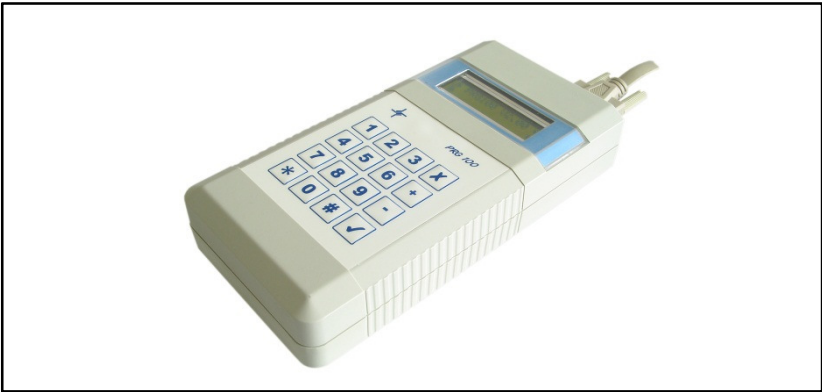
Programmiergerät PRG 100 V3 Bedienungsanleitung