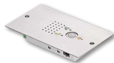
NRT 1 XS