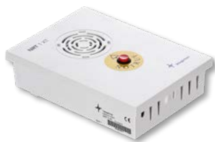
NRT 1 XT