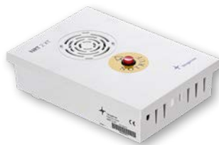
NRT 2 XT