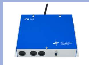
IP Gateway IPG140